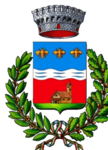
COMUNE DI PEDRENGO