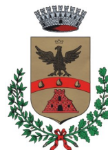
COMUNE DI PALOSCO