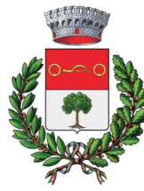
COMUNE DI OSIO SOPRA