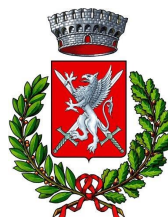
COMUNE DI OSIO SOTTO